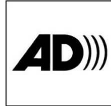
Có thuyết minh