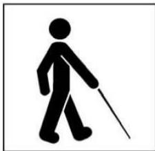
Người khiếm thị