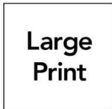
Bản in cỡ to