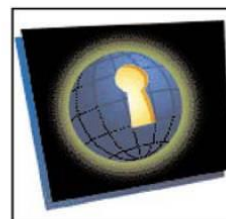
Tiếp cận Web