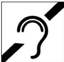
Người khiếm thính