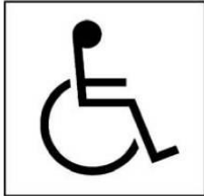
Biểu tượng đảm bảo tiếp cận quốc tế