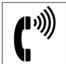
Điện thoại có điều chỉnh âm lượng nghe