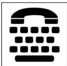
Điện thoại có bàn phím chữ