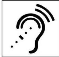
Thiết bị trợ thính